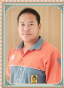
นายกิตติพล หาจินดา พ.ง.ขับเคลื่อนจักรกลเบา