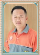
พ.จ.อ.ทวีป เชื้อสุวรรณ หัวหน้าฝ่ายป้องกันและบรรเทาสาธารณภัย