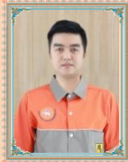
สิบทโหลมชัย ปะใจ จพง.ป้องกันฯปฏิบัติงาน