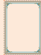
หัวหน้าฝ่ายสงเคราะห์และฟื้นฟูผู้ประสบภัย